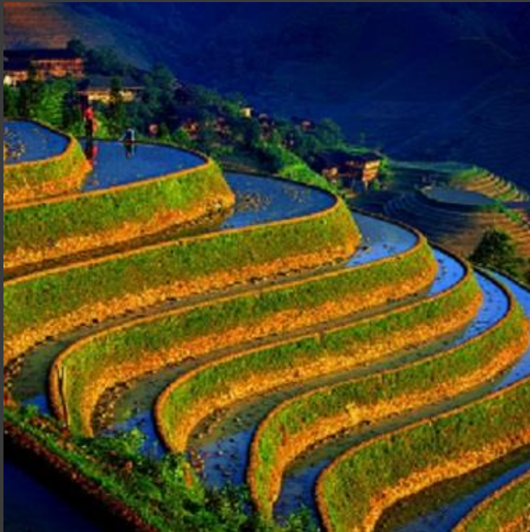
Preparo da terra em roça tropical