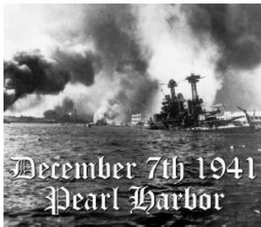
(Disponível em: http://bernielutchman.blogspot.com.br/2014/12/remember-in-december-pearl-harbor-day.html , Acesso em 15 abr. 2015)

1. (Upf 2015) A imagem mostra os resultados de um combate da Segunda Guerra Mundial.