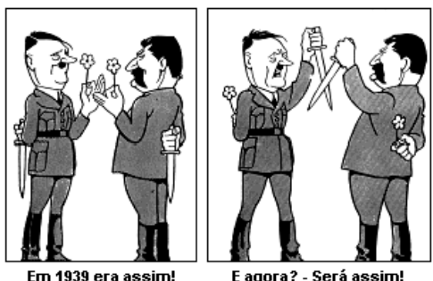
(BELMONTE, 1943. In: JAGUAR (org.). Caricatura dos tempos. São Paulo: Melhoramentos, 1982.)

A caricatura abaixo refere-se a dois momentos das relações entre a Alemanha e a URSS no entre-guerras.