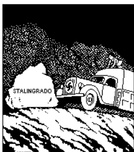
pedra na estrada (23-10-1942)

Os anos de 1941 e 1942 foram decisivos para o desfecho da Segunda Guerra Mundial. Identifique, na caricatura acima, um episódio e seu respectivo desdobramento para o desfecho da Segunda Guerra Mundial. ----- ----- ----- ----- -----